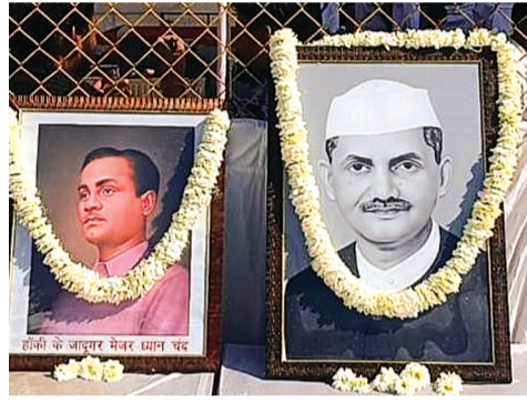
हरिभूमि ब्यूज गुना/राधौगढ़

रोमांचक फाइनल में लखनऊ हाॅस्टल ने रेलवे विलासपुर को 1-0 से हराया