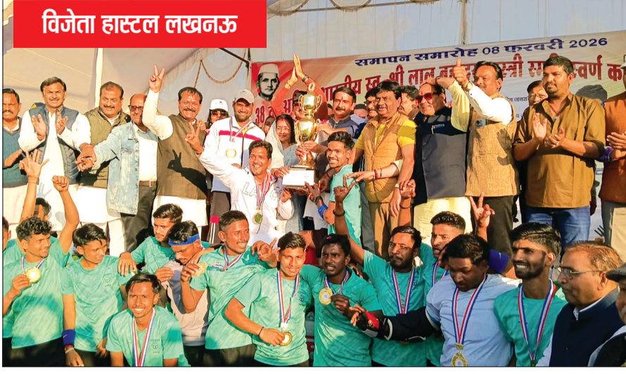
विजेता हास्टल लखनऊ