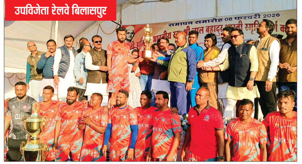
उपविजेता रेलवे विलासपुर

रोमांचक फाइनल में लखनऊ हाॅस्टल ने रेलवे विलासपुर को 1-0 से हराया